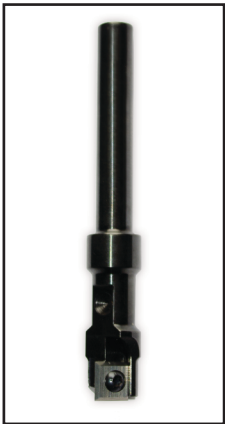
Afb. 2 - Beitel 132x18

Draai als eerste de stelbouten los en plaats de nokken in de uitsparing van de voorplaat ( Afb. 1 ). Schuif de zijkant tegen de deur aan en zet de bouten vast. De mal kan nu niet meer verschuiven. Zet de mal op het uiteinde van de zijkant met een quick-grip tang als extra zekering vast.