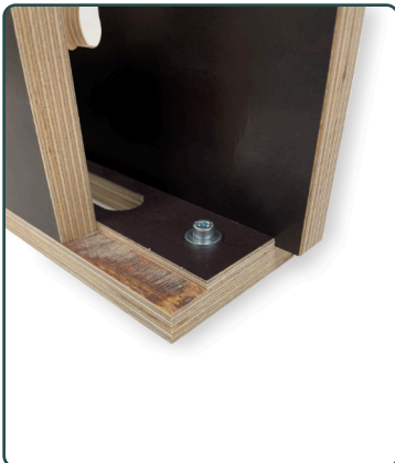
Afb. 2 - Stelbout voor het aanpassen van de doornmaat