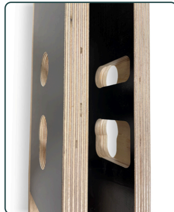
Afb. 3 - Uitsparingen voor afvoer van houtkrullen

Voor een overzicht van beschikbare slotkast freesmallen. Kijk dan op onze website: www.riens.nl