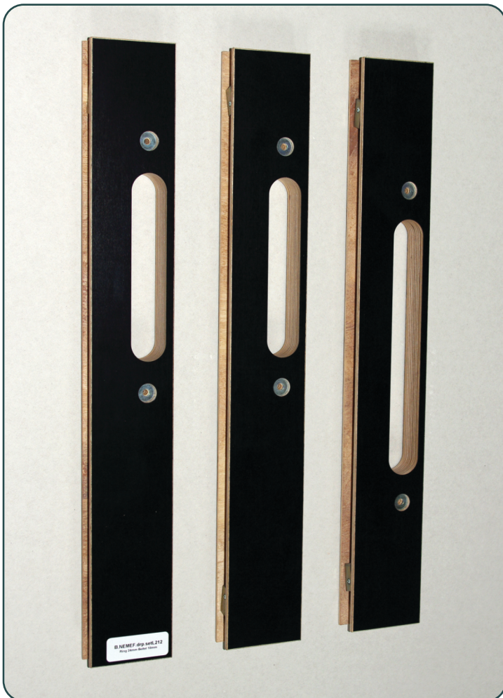
afb. 1 - Onderdelen van de freesmal - 2x bijzetkom, 1x hoofdkom

Onderdelen van deze mal zijn los te verkrijgen, daardoor kunt u simpel een kapot onderdeel vervangen.