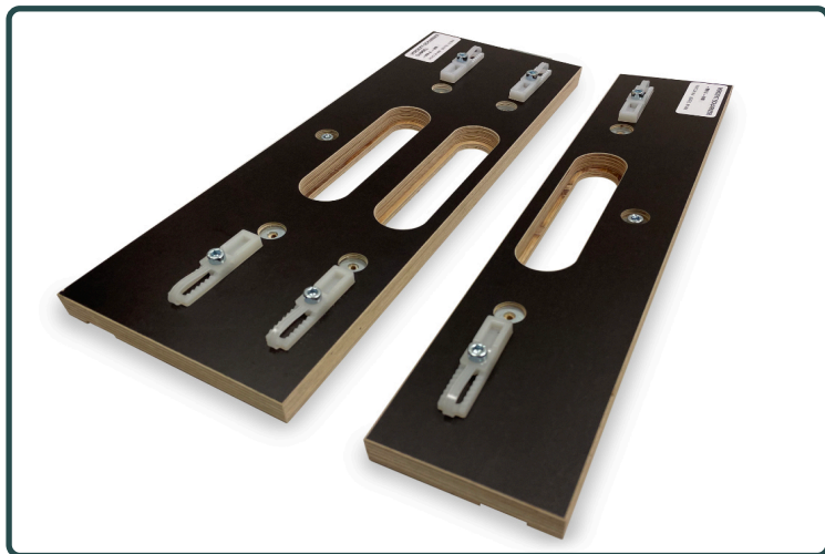
Afb. 1 | Enkele en dubbele uitvoering

De enkele freesmal is niet in alle sponningen te gebruiken. Dit komt omdat de plank te smal is, waardoor de strip tegen de buitenkant van het kozijn komt en je nog niet met de mal tegen de dagkant aan zit. Daardoor blijft er te veel achterhout zitten, waardoor je meer dan de 1,5 mm gebruikelijke speling tussen deur en kozijn krijgt. Afhankelijk van de breedte van het scharnier varieert de te gebruiken sponning grootte bij een enkele mal van 40 mm t/m 49 mm.