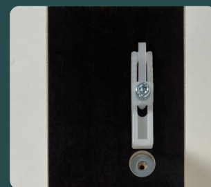
Afb. 3 | Zoolbegrenzer naar binnen

Draai de begrenzers naar binnen ( Afb. 4 ), dan botst de bovenfrees tegen de begrenzers aan en kun je het midden gedeelte dieper inkrozen, zonder de mal te verplaatsen.