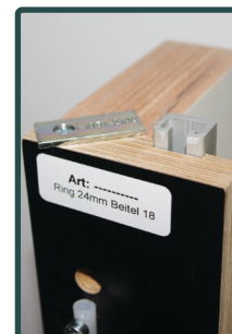
Afb. 4 | Aanslaglip

Dit profiel is tevens de aanslag tegen de achterkant van de deur ( Afb. 4 ). Met deze lengte kunt u deuren van 2015 mm tot 2400 mm frezen.