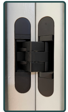
Afb. 7 - Resultaat

LET OP! Bij verdekte scharnieren mag het scharnier niet verdiept liggen in de kozijnstijl. Het scharnier moet gelijk liggen met oppervlakte van de sponning. Als het scharnier te diep wordt ingekroosd, verlies je mogelijkheid om het scharnier na te stellen.