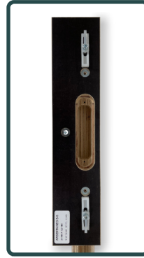
Afb. 5 - Mal op deur

Als de deur 38 mm of dunner is, adviseren wij om een aparte mal te laten maken, omdat het voorhout dan te dun wordt.