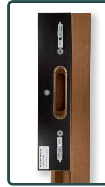
Afb. 6 - Mal in kozijn